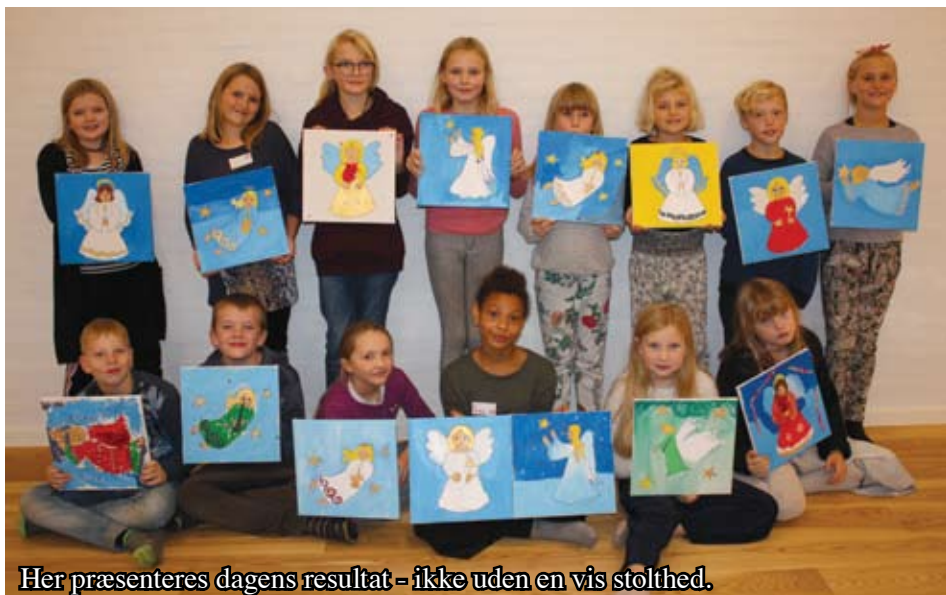
Her præsenteres dagens resultat - ikke uden en vis stolthed.

Vi har netop afholdt en temauge, hvor der blev malet engle i den helt store stil om torsdagen. Billederne skulle derefter med i kirken til familiegudstjenesten, hvor børnene havde en stor rolle som korsangere. En af dem var endda fungerende kordegn med ind- og udgangsbon.