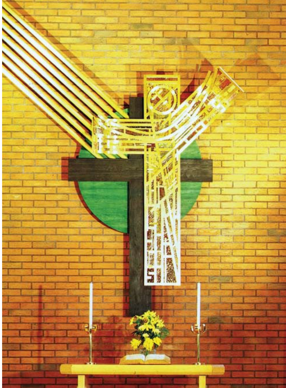
"Sognen" Rosengårdskirken Helsingør